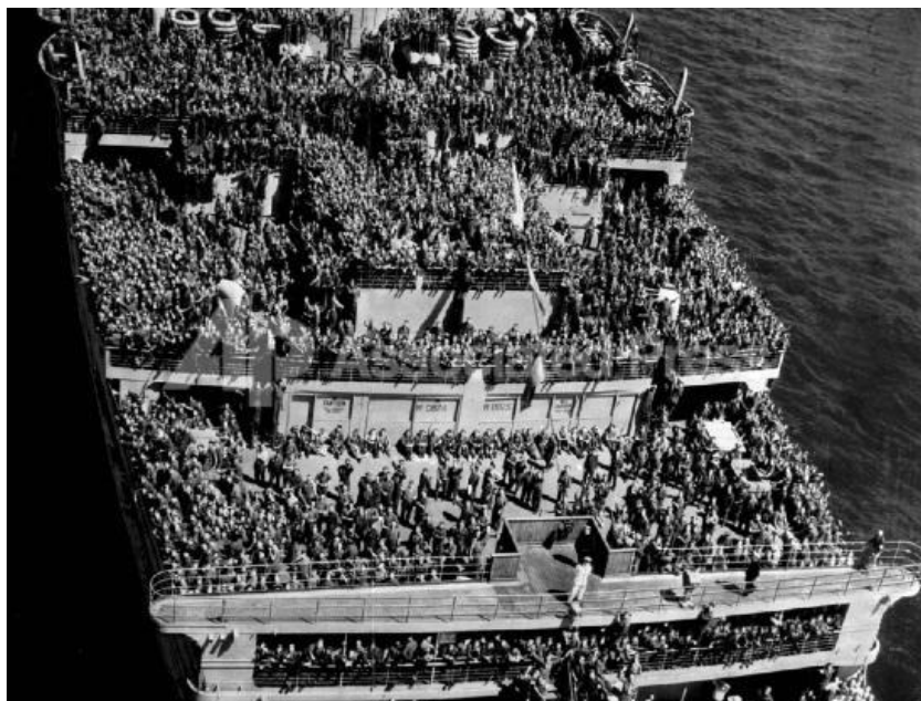
Le navire de transport de troupes Queen Mary avec à son bord une division de 15 000 soldats américains en partance vers l'Europe