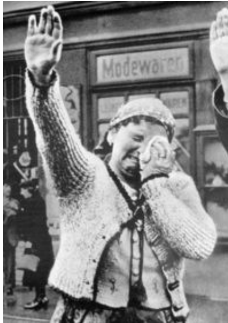
Femme tchèque pleurant tandis que les troupes allemandes occupent le reste de la Tchécoslovaquie en 1939.